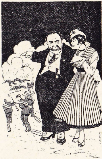
België's eerste minister Baron de Broqueville, wijzend naar de geeneuveldige Vlamingen — « Na den oorlog, chère amie, zullen die hun Vlaamsch niet meer noodig hebben! »