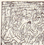
Gezondheidsregels worden er zeer hoog geacht Men geeft de getrouwerden overgees dag een bed.