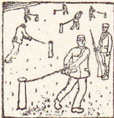
In een penitentiële kraai bewegen zij zich wil En hebben want te klagen over droefheid.