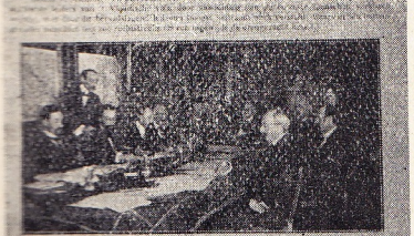
De Vlaamsche Regering

De Vlaamsche Regering is niet een regering van de Vlaamsche soldaten, maar een regering van de Vlaamsche volk. De Vlaamsche soldaten zijn de Vlaamsche soldaten van de Vlaamsche volk. De Vlaamsche soldaten zijn de Vlaamsche soldaten van de Vlaamsche volk. De Vlaamsche soldaten zijn de Vlaamsche soldaten van de Vlaamsche volk.