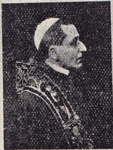
De Vlaamsche soldaten

Wacht niet op de Vlaamsche beweging, die door de Vlaamsche soldaten wordt voortgezet. De Vlaamsche beweging is niet een beweging van de Vlaamsche soldaten, maar een beweging van de Vlaamsche volk. De Vlaamsche soldaten zijn de Vlaamsche soldaten van de Vlaamsche volk. De Vlaamsche soldaten zijn de Vlaamsche soldaten van de Vlaamsche volk. De Vlaamsche soldaten zijn de Vlaamsche soldaten van de Vlaamsche volk.