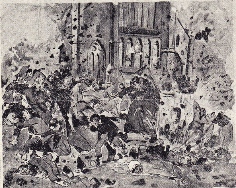
Op 22. 9. 17. Jerozeli beschieting van Oostende.